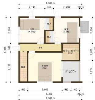
Second floor plan 2 階